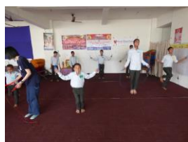
二重跳びが難しい！

前回に引き続き、訪問した学校・施設で体育のレクリエーション活動を行いました。ネパールの学校では体育の授業や運動をする習慣があまりなく、学校によっても運動環境に差があります。狭いスペースでも道具があれば実施できる運動の幅が広がります。従って今回は道具を使ったレクリエーションに挑戦しました。種目は縄跳び、ドッジビー(柔らかい素材でできたディスクを使ったスポーツ)、ドッジボールです。縄跳びとドッジビーではうまくできない子もいましたが「もっとやりたい！」と楽しそうに取り組んでくれました。ドッジボールでは子どもたちはルールを覚えるのが早く、ボールもしっかり投げられていました。男女問わず積極的な姿勢が見られ、非常に盛り上がりました。また、ボランティアの方が子どもたちに魔方陣のレクリエーションを行いました。理数系が得意な子どもたちはほとんどヒントがなくても解いていきます。苦戦しつつも途中で投げ出さず楽しそうに真剣に取り組む姿にスタッフ一同感心しました。