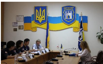
ジトーミル副市長との面会

オブルチ市役所では市長にお会いし、オブルチの子どもたちを日本へ招待することを伝えました。市長は「福島市とオブルチ市が姉妹都市となり、今後は福島の子どもたちにオブルチを見てもらいたい」と話してくださいました。また、現在の財政危機の影響でチェルノブイリ事故の処理が国内だけでは賄えず外国から支援を受けていることや、ヨーロッパ諸国の核廃棄物を受け入れる処理所をウクライナの汚染地域内に設立したことなども伺い、事故から30年以上たった今なお多くの課題が残されていることを痛感しました。