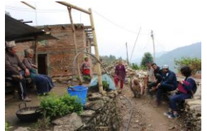
取材中続々と村人が集まる