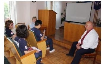
多忙の中時間を割いてくれたオブルチ市長