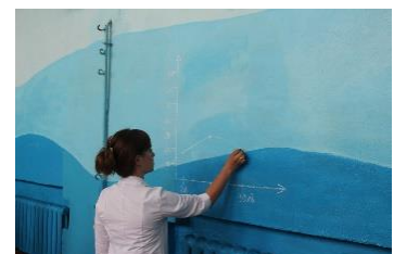
生徒が測定した脈拍を記録する看護師