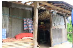
ラトナマヤさんが暮らす