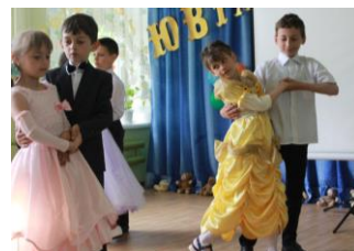
大人びた表情で踊る園児