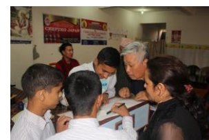
魔方陣にみんな興味津々！