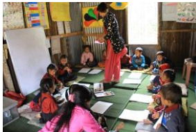
未就学児の教室は机がない