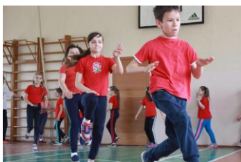
体育の授業。まずはウォーミングアップから

体育教諭は5年制の体育大学を卒業しないと免許が取れず、さらにその後も5年ごとに研修を受けて免許を更新する必要があります。教育制度は整っていますが、一方でボールなど道具の数や質が不十分であったり、体育館の床に穴が開いていたり設備の面での欠点が目立ちました。