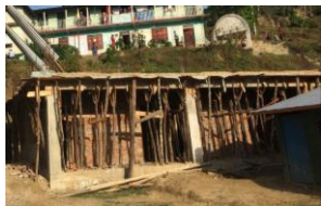
1年の間に修復された校舎

現在教員やスタッフの数も十分ではありませんが、政府に対して教員の追加を申請できるのは生徒が200人以上いる学校のみです。そのため同校が先生を増やしたければ独自で雇うしかありませんが、雇うとなれば1人あたり5,000～15,000円(勤務形態による)が必要になります。因みに、政府が派遣している教員の給料は中学生担当で31,000円、それ以下が20,000～24,000円程度です。しかし、教員からすれば町に住むには全然足りない金額です。