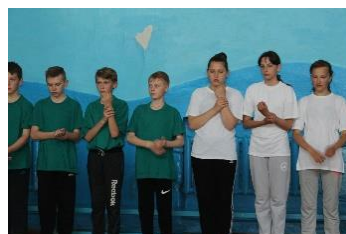
運動後に脈拍を測る生徒