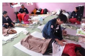
たくさんの村人が来場