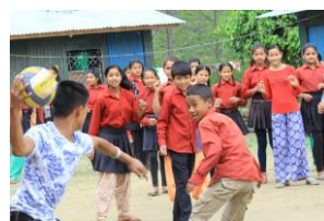
素晴らしいフォーム！ 容赦ない投球スピード！