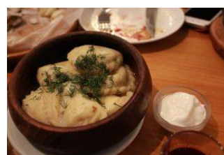
ウクライナ版餃子「バレーニキ」。 具はひき肉、チーズ、イチゴなど...