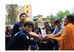
ライジングロータス・・・30万円