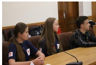
交流プログラムで日本に来た3人