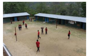
バレーボールネットがある校庭 トタンの炊事場(左奥)と 未就学児の教室(右)