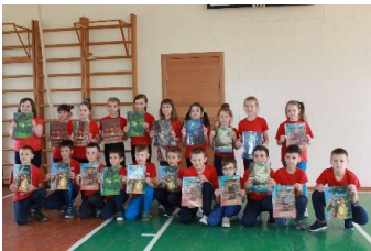
支援物資としてクリアファイルをプレゼント ジトーミル第12学校(左)、オブルチ第3学校(右)

精神病院では子どもたちにラジオ体操を教えたり、一緒に折り紙で紙飛行機を折ったりと簡単ではありますが、日本文化の一部を紹介し、交流を図りました。