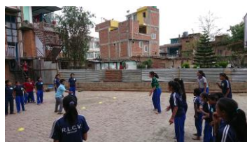
初めてのドッジビー！