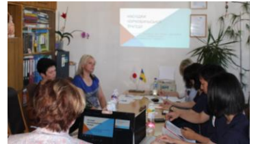
ウクライナの健康被害についての発表