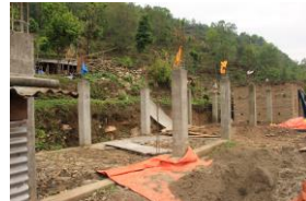
全壊した家を再建中