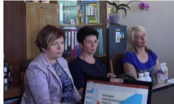
シンポジウムの参加者

また、現在深刻な問題なのは病気になっても治療費が高すぎて補助金だけでは賄いきれないということです。別の病院でも話を聞いたところ、「ウクライナ人にとって一番怖いことは病気になることだ」と言っていました。日本のような皆保険制度がないウクライナでは診察費は無料でも薬代や治療費が高く、そのまま亡くなる人も少なくないと言います。