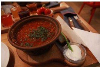
実はボルシチには赤(左)と白(右)の2種類があります。 どちらもサワークリームを入れて飲むのが特徴！！

日本から遠く離れた東欧ウクライナ。そんなウクライナの料理と聞いて何を思い浮かべますか？なかなかピンとこないですよね。ところが、実は日本でも有名なボルシチはロシアではなく、ウクライナ発祥の料理です。ほかにも蒸した餃子やハンバーグのようなおかずなど意外と日本人に馴染み深い味が多いです！デザートにはアイスクリームやイチゴが多かったです。そんなウクライナの食卓を少しご紹介します。