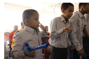
縄跳びできるかな～？