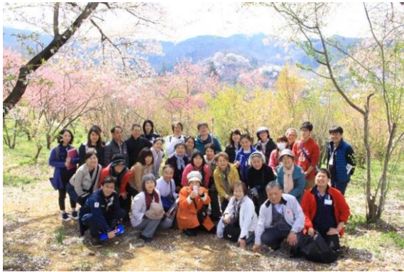
2018年4月8日 福島市花見山にて

知っていますか？「ふくしま産」のこと～風評被害について考える～ 今回のツアーの目的:「ふくしま産は安全！？ ふくしまのファンになってほしい！」