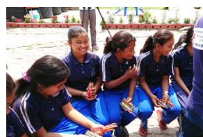
鉛筆を受け取り目を輝かせる子どもたち