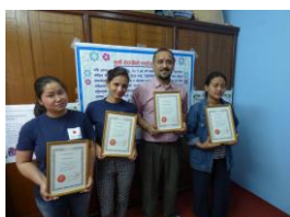
現地人初のセラピスト誕生！

ネパールでは生活水準が低く、その影響もあり教育環境が整っていません。教育が必要な状況でありながら、学習環境が整っていないために勉強をすることができない子どもたちがたくさんいます。また、子どもの成長において様々な運動を行うことは体力的にも精神的にも非常に重要なことです。しかし、運動を行うための道具がなかったり、実施スペースが狭かったりと環境に問題があります。チェフコでは今後も学習環境、運動環境の整備を目指して支援を行っていききたいと思います。