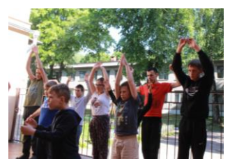
ラジオ体操に挑戦する子ども