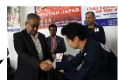
ラダクリシュナ コミュニティセンター・・・20万円